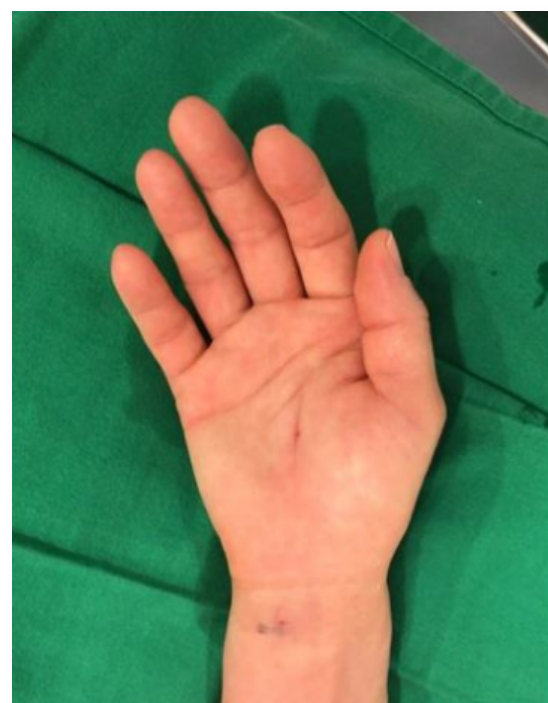
초미세침습인대절제술 직후의 모습