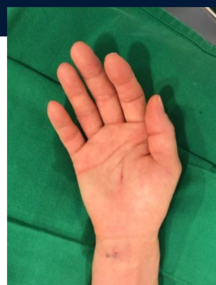
초미세침습인대절제술 직후의 모습