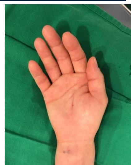
초미세침습인대절제술 직후의 모습